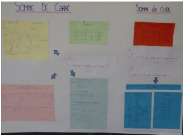
Suite de Catalan (Bastien Borne, Maëlle Pélissier, Gwendoline Degré, Sébastien Bourjac)