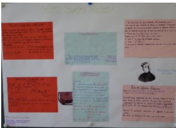
Des suites dans les idées: a,b,c (Terrier, Vidau, Rio, Liataud, Subtil)